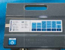
Komfortabel: AquaControl-Box und Funk-Fernsteuerung